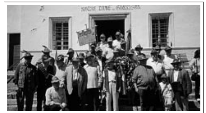
Courmayeur. La Corona d'alloro per i Caduti