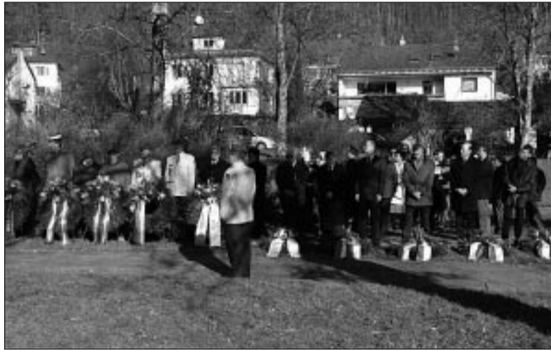
Münsingen. Resa degli onori ai Caduti

Eravamo arrivati a Münsingen nel primo pomeriggio (poiché, ormai, un simile viaggio si deve fare almeno in due tappe), attraversando il Tirolo in direzione nord/est, con un tempo magnifico che, per fortuna sarebbe durato anche l'indomani, e con un paesaggio tutto da godere.